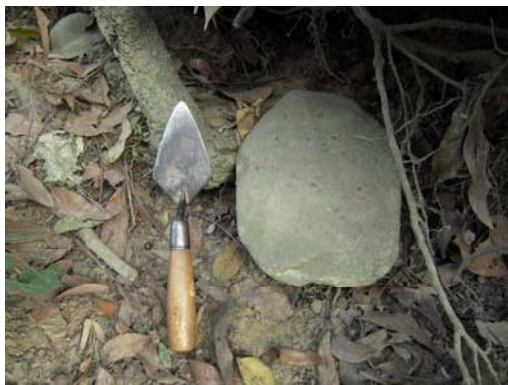
圖說：地表採集之以大件石材略加修整並使用之石器，刃端有磨耗使用痕跡