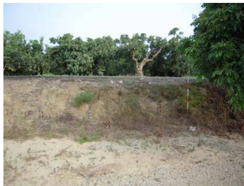
圖說：位於路邊邊坡上可見少許細碎的夾砂陶片